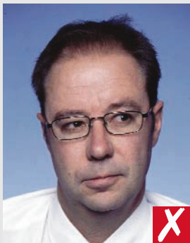
olhando p/ o lado