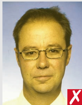
tom de pele não natural